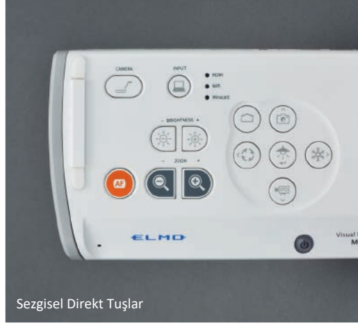
Sezgisel Direkt Tuşlar