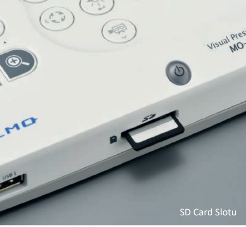
SD Card Slotu